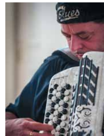
Foto Heinichen: privat; Fotos Berndorf, Willisohn: Thomas Weber, Emsdetten