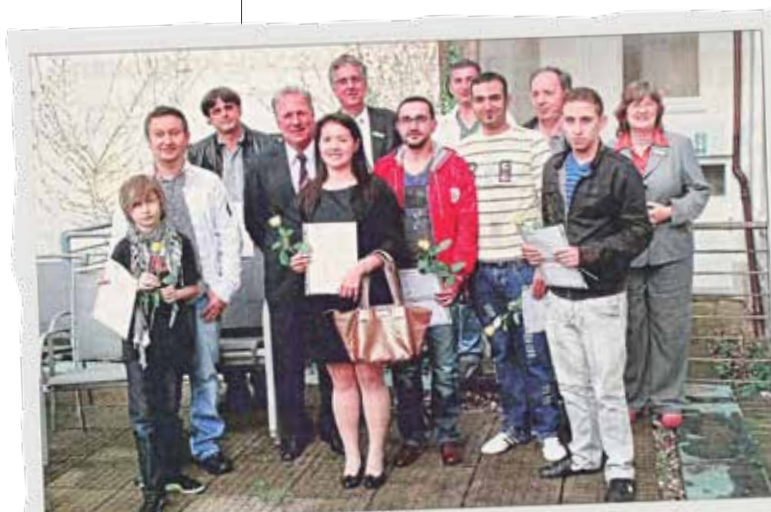
Die erfolgreichen Teilnehmer des Integrationskurses.

„Ich leite seit 20 Jahren den Gesprächskreis ‚Umgang mit Angst, Panik und Depressionen‘. Im Juni 2012 durften wir unser Jubiläum feiern. Viele Menschen sind mir begegnet, sie haben mir viel gegeben, mit all den guten, tiefen Erfahrungen. Voll Dankbarkeit blicke ich zurück – und nach vorne ... das Leben ist schön.“