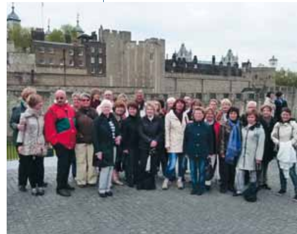
Alle kamen zu der Erkenntnis: beautiful London, we 'll be back, ja, wir kommen wieder!

gang durch Chinatown und Covent Garden und besonders das Fußballspiel Bayern gegen Chelsea in einem urigen Pub waren ein ebenso spannendes Erlebnis. Ein Ausflug zum Windsor Castle brachte die Gruppe mitten hinein in die Parade zum 60-jährigen Thronjubiläum der Queen. Und immer wieder wurden die Teilnehmer gefordert, ihre Englischkenntnisse zu testen. Einige kamen zu dem Ergebnis, dass diese alte Stadt voller Museen, Altertümer und Attraktionen jung und modern ist. Trotz der Kürze des Wochenendes schafften die weiblichen Teilnehmer auch noch eine Shoppingtour!