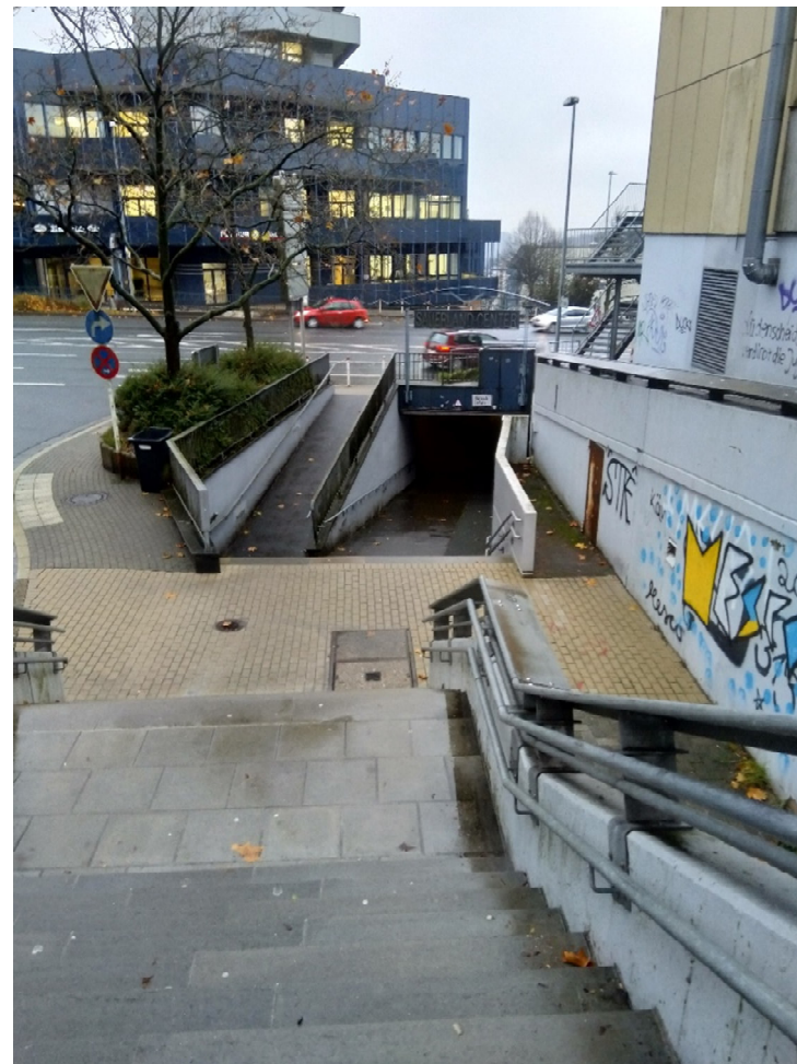
Fußgängerweg an der Seite des Forums zum Tunnel Sauerfelder Straße