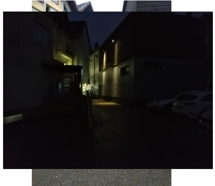
Kindergäßchen von der Karlstraße (tagsüber)