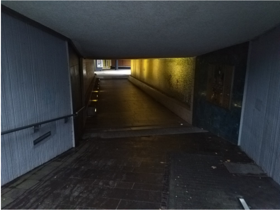
Eingang Tunnel unter der Sauerfelder Straße (Seite Forum)