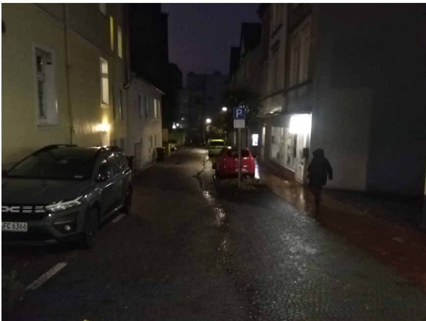
Börsenstraße Richtung Hintereingang Forum am Sternplatz