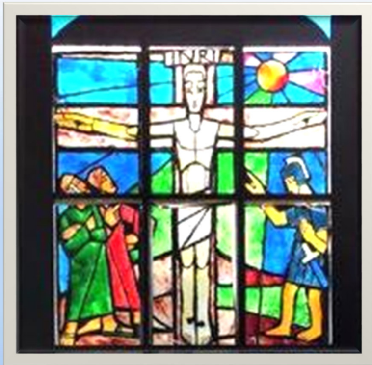
Gemeindezentrum Rathmecke/Dickenberg Rathmecke 32 58513 Lüdenscheid

Das Arche Care Haus Karlshöhe 6 58513 Lüdenscheid